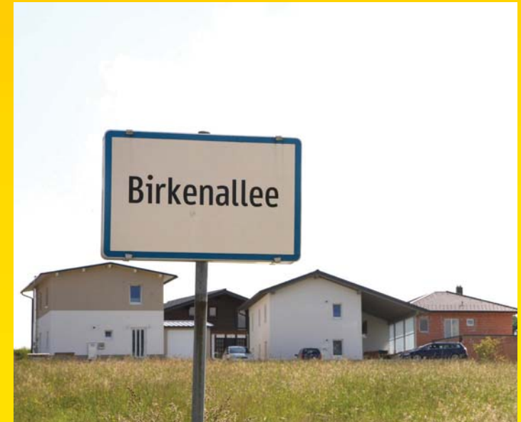
Siedlungserweiterung in Pomedt, Birkenallee, Schwabenbach und Schwaben