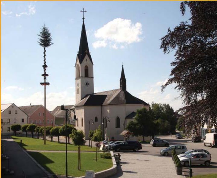
Neugestaltung des Marktplatzes unter SPÖ - Bauausschussobmann Günter Ortner