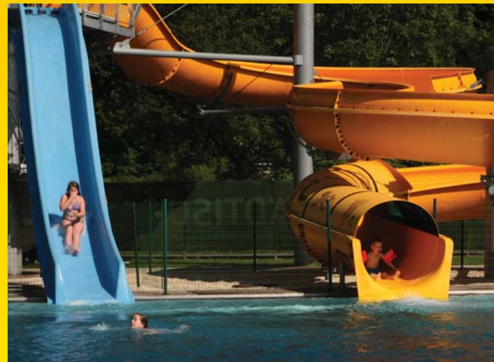
Um die Attraktivität des Freibades zu erhalten wurden 2010 zwei neue Rutschen angekauft.