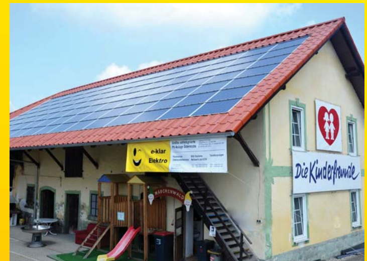
Größte integrierte Photovoltaikanlage Österreichs am Nebengebäude vom RIKI