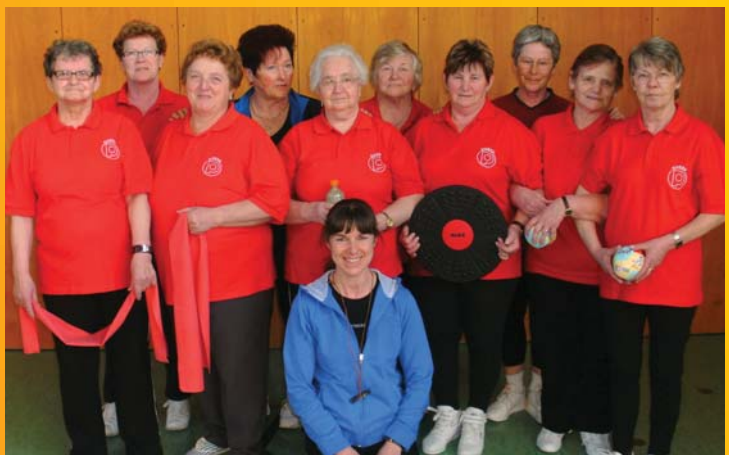
Der Pensionistenverband Riedau organisierte viele Ausflüge, Reisen, Sozialsprechtage und sportliche Aktivitäten die von vielen Riedauer BürgerInnen in Anspruch genommen wurden.