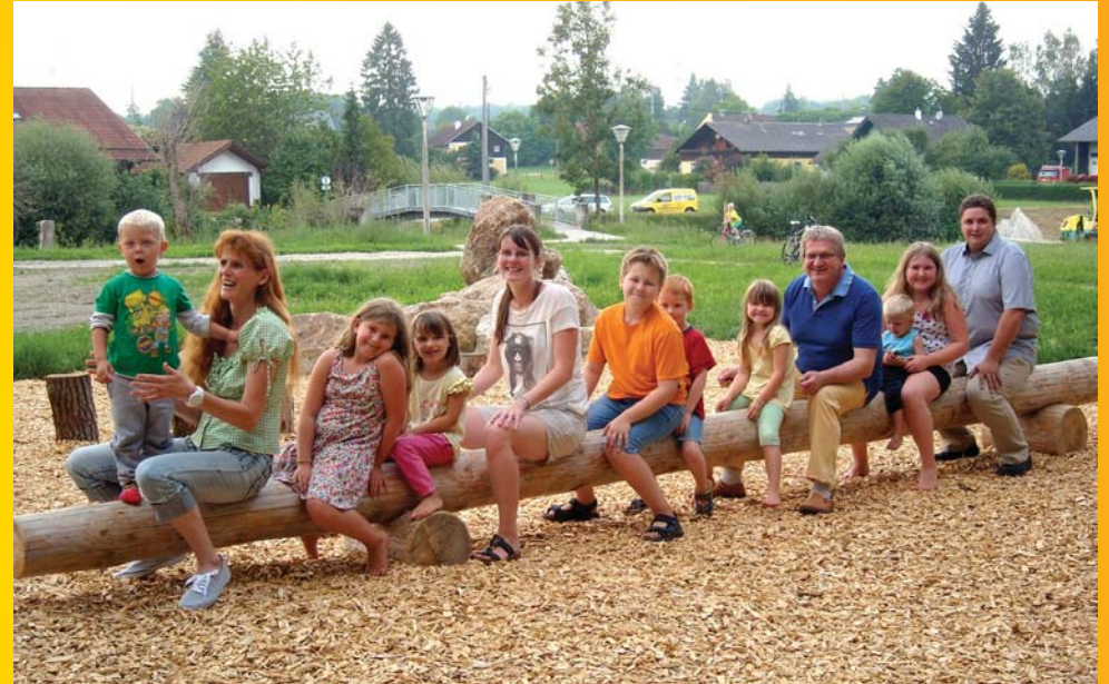
Naturspielplatz Kellerleiten - neues Angebot für Familien