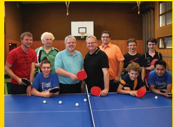
Gratis Hallenbenützung bleibt: Nach langer Suche konnte ein Weg gefunden werden, die Hallenbenützungsgebühren abzuwenden.