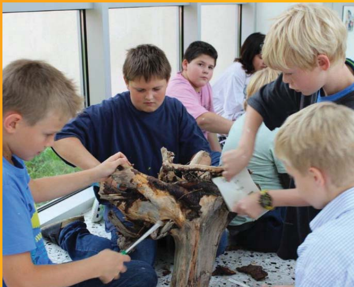
Schulprojekt: SchülerInnen bei der Vorbereitung einer Baumwurzel