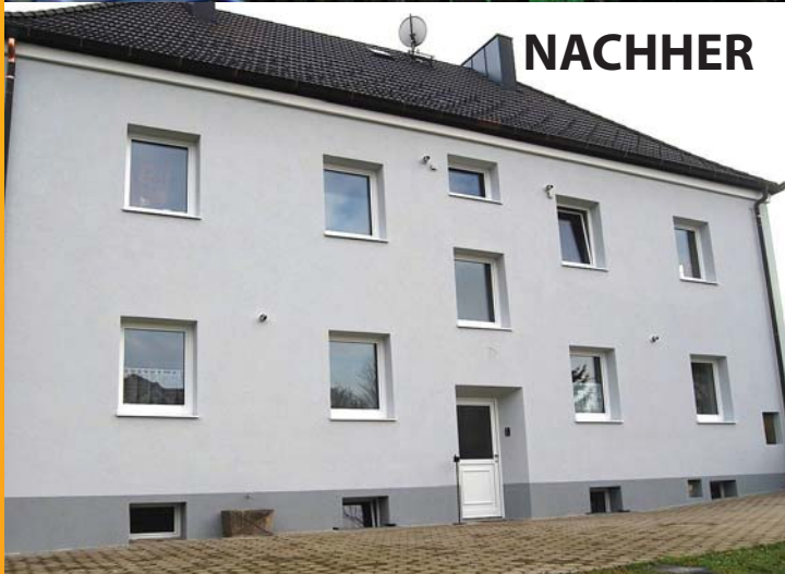
2012 wurde das Gemeindewohnhaus außen komplett renoviert.