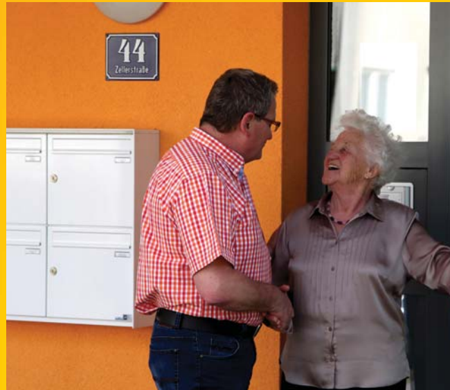
2011 wurden in der Zellerstraße 44 die Schlüssel den MieterInnen übergeben.