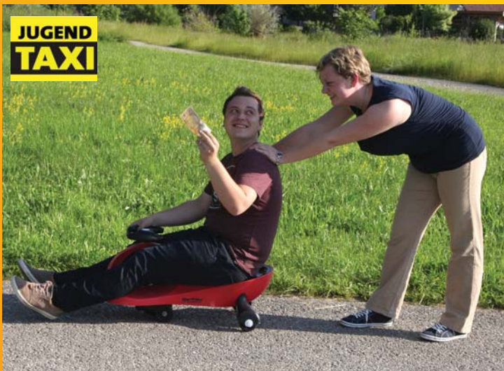
Durch den Antrag der SPÖ wurde das Jugend-taxi 2010 eingeführt und jedes Jahr verlängert.