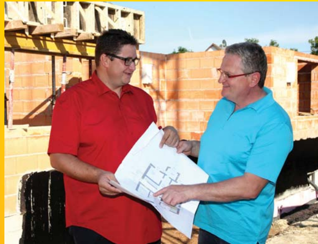
Besichtigung des Baufortschritts der neuen Wohnungen „Am Schlossgrund“ - Fertigstellung 2016