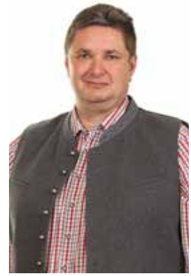
Franz Arthofer Vizebürgermeister

Leider wurde bei einer Bewerbung zum Jahreswechsel 22/23 von einem gelernten Badewart, aufgrund voll besetztem Dienstpostenplan, zu lange zugewartet. Um den Badebetrieb mit einer Person aufrecht zu erhalten, wurde vom Bürgermeister ein Vorschlag ausgearbeitet, der eine eingeschränkte Öffnungszeit (5 Tage pro Woche) vorsieht. Ich empfehle eine Jobausschreibung ohne der Bedingung "Facharbeiter:in", damit leichter Bewerber:innen gefunden werden.