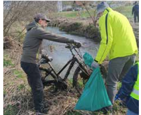
Die Teilnehmer der "Hu Pfui" haben in der Pram sogar ein Fahrrad gefunden.

DANKE an ALLE, die sich engagieren und dazu beitragen Riedau sauber zu halten!